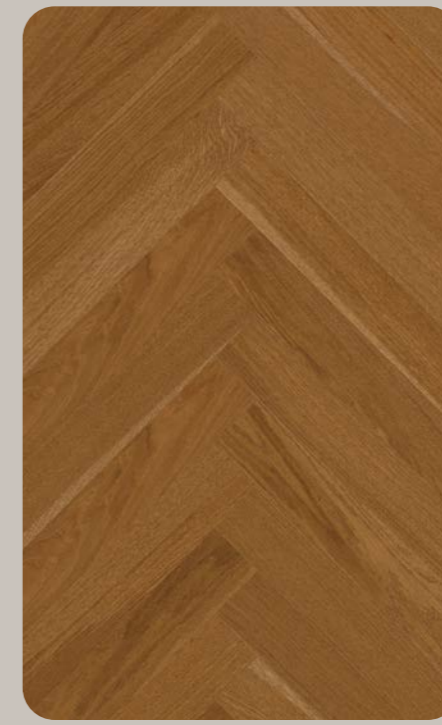
Eiche VITARIA OriginFischgrät 547.8 × 91.3 × 6.3 mm