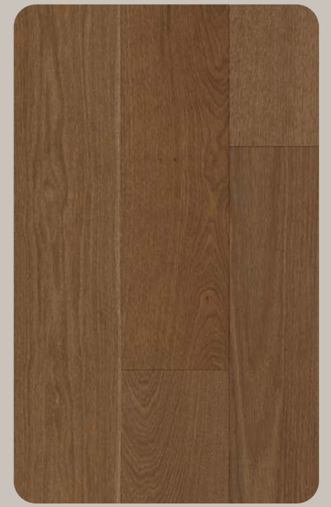
Eiche REVONA Origin 612-1230 × 196.5 × 6.3 mm