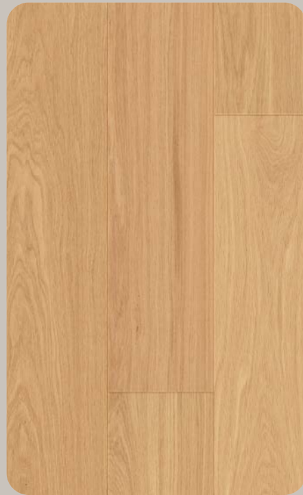
Eiche FUTURIS Esthetic 770-1546 × 196.5 × 6.3 mm