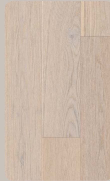
Eiche AURANTIS Esthetic 770-1546 × 196.5 × 6.3 mm