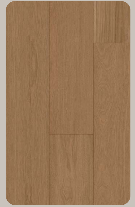
Eiche VERANO Esthetic 612-1230 × 196.5 × 6.3 mm