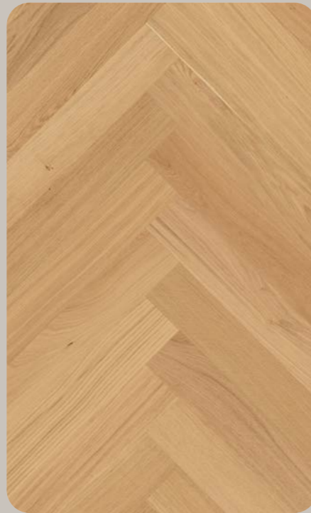
Eiche FUTURIS Esthetic Fischgrät 632 × 126.4 × 6.3 mm