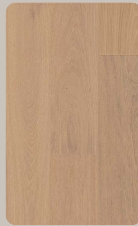
Eiche EVANA Esthetic 612-1230 × 196.5 × 6.3 mm