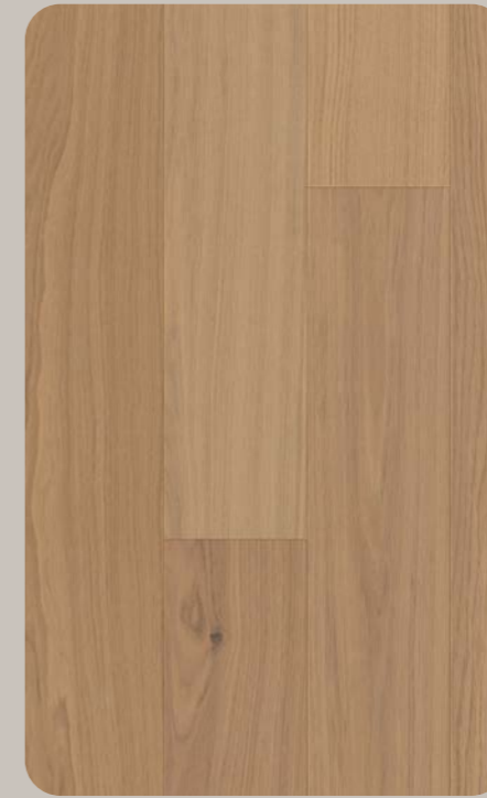
Eiche HARMON Esthetic 612-1230 × 166.5 × 6.3 mm