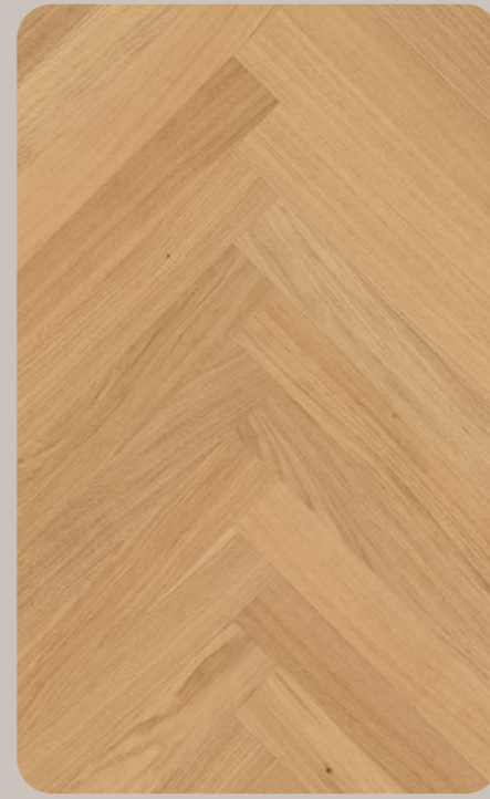
Eiche FUTURIS Esthetic Fischgrät 547.8 × 91.3 × 6.3 mm