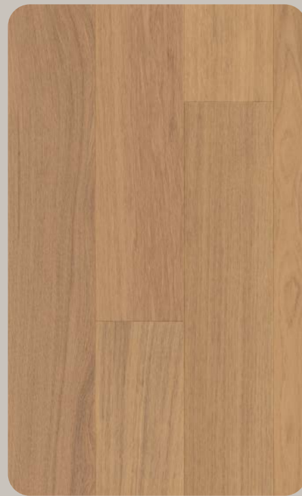
Eiche ESSENZA Esthetic 612-1230 × 166.5 × 6.3 mm