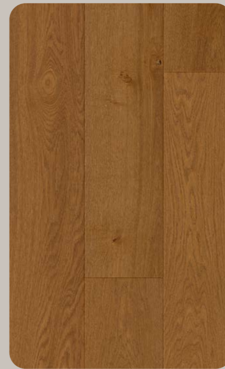
Eiche VITARIA Origin 770-1546 × 196.5 × 6.3 mm