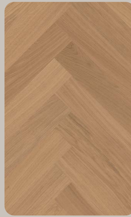
Eiche ESSENZA Esthetic Fischgrät 632 × 126.4 × 6.3 mm